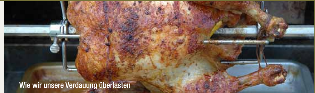
Wie wir unsere Verdauung überlasten

Entscheiden wir uns für die richtigen Lebensmittel, legen wir den Grundstein für eine gut funktionierende Verdauung; mit einer konsequenten Ernährungsumstellung lassen sich in sehr vielen Fällen Darmbeschwerden heilen. (Tipps finden Sie in der Broschüre „Wärme & Nahrung“ des Hara Shiatsu Institut)